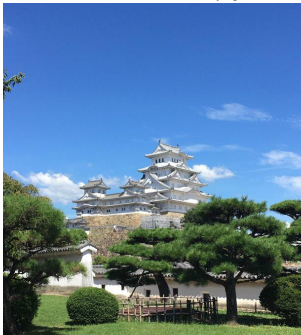
Himeji slott, grundad 1333 – ett av de äldsta ännu existerande slotten från det medeltida Japan.

Förutom akademiska möten, föredrag, keynoter och plenarsessioner, fick vi också vara med på olika sociala aktiviteter och utflykter. Under utflyktsdagen den 6:e september besökte vi Himeji slott som ingår i Unescos världsarvslista och Hyogo Prefectural Museum of History.