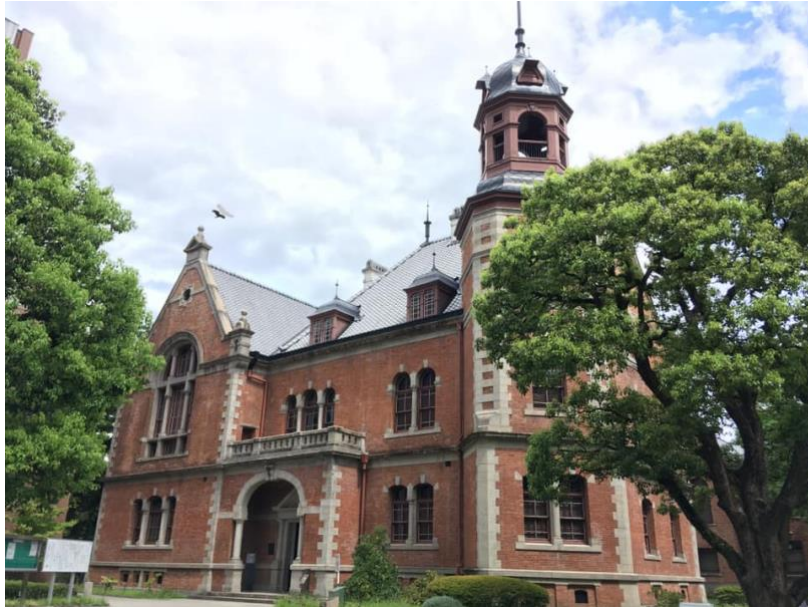
Clarke Memorial Hall, Doshisha University, Kyoto – en del av det japanska materiella kulturarvet

Doshisha universitet grundades i 1875 som ett lärosäte för kristen utbildning i Japan – ”Doshisha English School”.