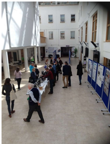
Fika, vi börjar strömma ut i the Portland building.

Ovan nämnda föredrag är bara en bråkdel av de cirka 60 som presenterades. Till dessa ska läggas en hel del posters. Föredrag, kafferaster och lunch hölls på samma ställe i en av Universitetet i Portsmouths byggnader vilket var utmärkt eftersom det därmed gavs god tid att samtala med kollegor på raster. Ungefär 130 delegater från hela världen deltog.