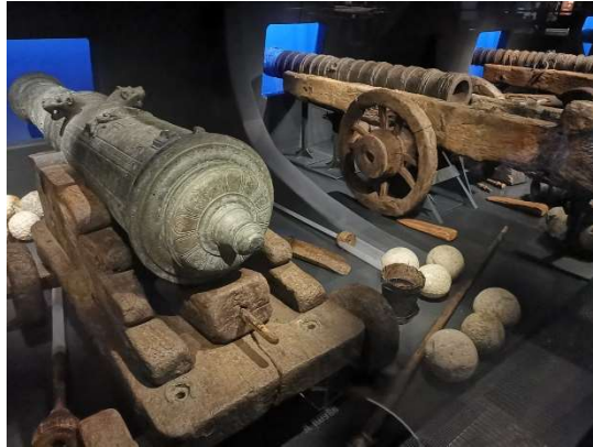
Mary Rose och några hennes kanoner

Inom det gamla varvsområdet där Mary Rose nu är utställd har hon också konserverats. Här finns också konserveringslokalerna där alla övriga fynd har tagits hand om. Här pågår fortfarande viss konservering och en del fynd magasinerar här. Besöket här innebar att man fick visa pass eftersom området det fortfarande är militärt.