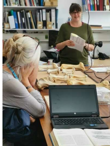
Botanik och osteologiverksamhet på Historic England.