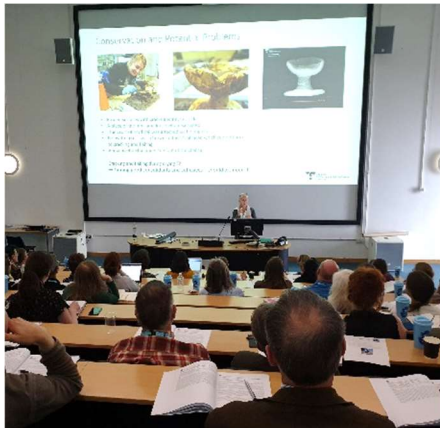
Presentation av Nya Lödöse projektet

På eftermiddagen hade jag möjlighet att presentera mitt föredrag om Nya Lödöse och några intressanta fynd därifrån, en läderjacka och en kalk och paten av bivax.